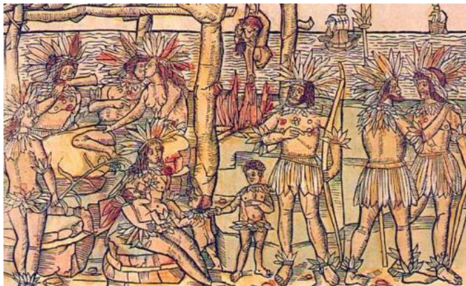
Johann Froschauer. Imagem do Novo Mundo. Xilogravura aquarelada a mão. 22x33cm. Mundus Novus, Augsburg, 1505.

Observe a imagem e responda o que se segue.