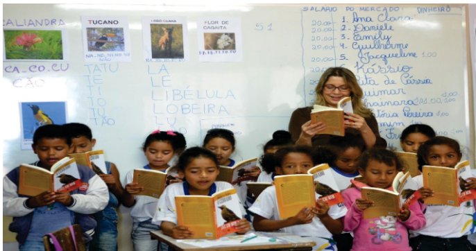
Por Mariana Tokarnia, Agência Brasil, Brasília, em 06/04/17 <acesso em 26/02/2019.

A imagem a seguir retrata uma sala de aula, na qual a professora e as crianças estão participando de um evento de letramento (SOARES, 2003, 2004).