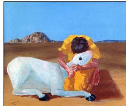
III. Menino com carneiro, 1954. Óleo sobre tela.

Os autores das obras são, respectivamente: