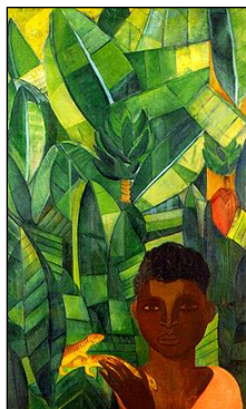
I. Menino com Lagartixa, 1924. Óleo sobre tela.