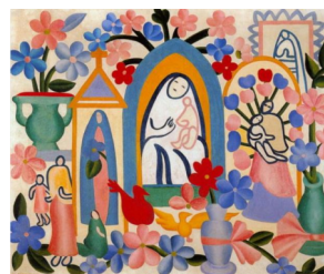
Figura 4: Religião Brasileira (1927)