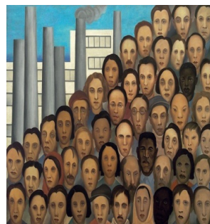
Figura 2: Operários (1933)