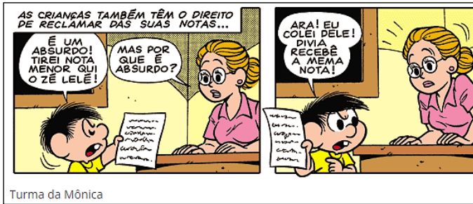
Turma da Mônica