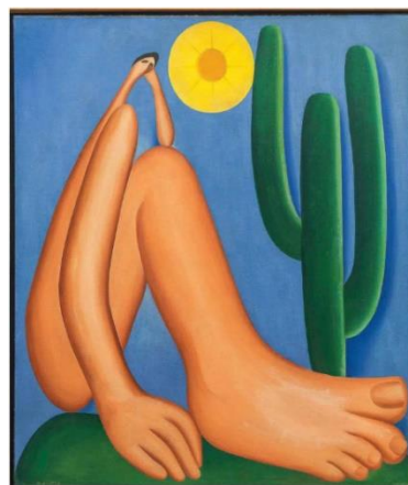
(Disponível em: https://conhecimentocientifico.com/historia-da-arte-no-brasil/ .)

A História da Arte no Brasil teve início com pinturas rupestres e se desenvolveu acompanhando a sociedade em diferentes períodos.