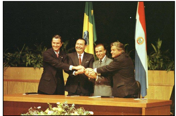
(Assinatura do Tratado de Assunção, que criou o Mercosul, em 1991. Na foto, da esquerda para a direita, presidentes Fernando Collor de Mello (Brasil), Andres Rodrigues (Paraguai), Carlos Menem (Argentina) e Luis Alberto Lacalle (Uruguai) Disponível em: https://gauchazh.clicrbs.com.br/mundo/noticia/2021/03/mercosul-completa-30-anos-nesta-sexta-feira-relembra-a-historia-do-bloco-ckmlzf1v001t01f1vfg6rk9p.html.)

O ano de 2021 assinalou os 30 anos de fundação do MERCOSUL. O bloco econômico foi erigido buscando inclinar a América do Sul para um diálogo necessário diante dos entraves políticos que nortearam sua história conturbada, assim como inserir tais países numa perspectiva de mundo globalizado. Contudo, muitas fissuras ainda são perceptíveis e ameaçam a seguridade dessa proposta original.