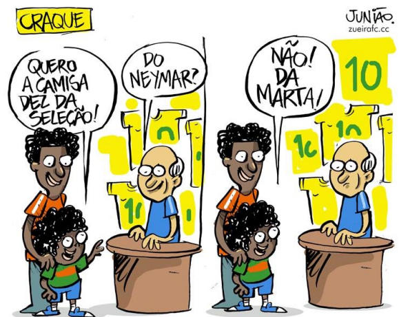
(Disponível em: http://www.juniao.com.br/wp-content/uploads/2014/02/xCharge_Zueira_Olimpiadas_BrasilxAfricadoSul_04_08_72.jpg .)

A charge demonstra uma realidade posta em discussão na sociedade brasileira da atualidade. Essa transformação de pensamento está associada à questão de: