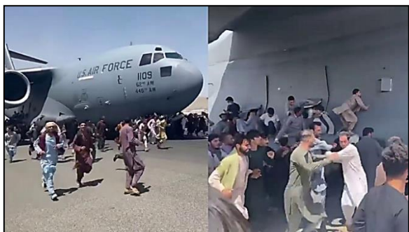
(2021 – Disponível em:

https://www.bbc.com/portuguese/internacional-58254615 .)