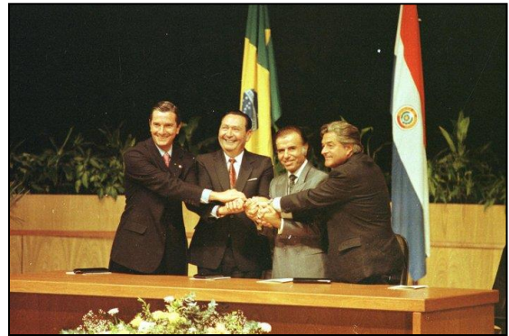
(Assinatura do Tratado de Assunção, que criou o Mercosul, em 1991. Na foto, da esquerda para a direita, presidentes Fernando Collor de Mello (Brasil), Andres Rodrigues (Paraguai), Carlos Menem (Argentina) e Luis Alberto Lacalle (Uruguai))

O ano de 2021 assinalou os 30 anos de fundação do MERCOSUL. O bloco econômico foi erigido buscando inclinar a América do Sul para um diálogo necessário diante dos entraves políticos que nortearam sua história conturbada, assim como inserir tais países numa perspectiva de mundo globalizado. Contudo, muitas fissuras ainda são perceptíveis e ameaçam a seguridade dessa proposta original.