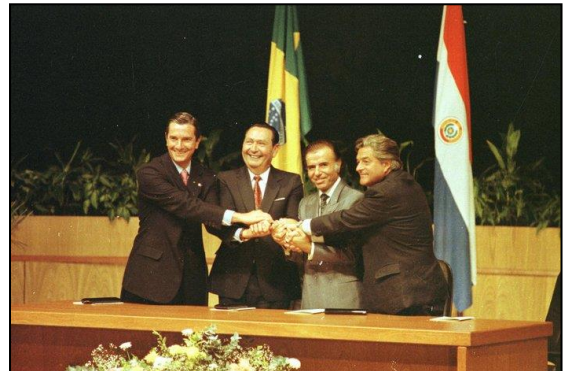
(Assinatura do Tratado de Assunção, que criou o Mercosul, em 1991. Na foto, da esquerda para a direita, presidentes Fernando Collor de Mello (Brasil), Andres Rodrigues (Paraguai), Carlos Menem (Argentina) e Luis Alberto Lacalle (Uruguai))

O ano de 2021 assinalou os 30 anos de fundação do MERCOSUL. O bloco econômico foi erigido buscando inclinar a América do Sul para um diálogo necessário diante dos entraves políticos que nortearam sua história conturbada, assim como inserir tais países numa perspectiva de mundo globalizado. Contudo, muitas fissuras ainda são perceptíveis e ameaçam a seguridade dessa proposta original.