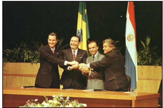
(Assinatura do Tratado de Assunção, que criou o Mercosul, em 1991. Na foto, da esquerda para a direita, presidentes Fernando Collor de Mello (Brasil), Andres Rodrigues (Paraguai), Carlos Menem (Argentina) e Luis Alberto Lacalle (Uruguai) Disponível em: https://gauchazh.clicrbs.com.br/mundo/noticia/2021/03/mercosul-completa-30-anos-nesta-sexta-feira-relembra-a-historia-do-bloco-ckmlzf1v001t01f1vfg6rk9p.html.)

O ano de 2021 assinalou os 30 anos de fundação do MERCOSUL. O bloco econômico foi erigido buscando inclinar a América do Sul para um diálogo necessário diante dos entraves políticos que nortearam sua história conturbada, assim como inserir tais países numa perspectiva de mundo globalizado. Contudo, muitas fissuras ainda são perceptíveis e ameaçam a seguridade dessa proposta original.