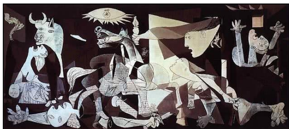
(Pablo Picasso: Guernica , 1937. 350 x 780 cm. Prado, Madri.)

O pintor espanhol Pablo Picasso e o pintor lituano Lasar Segall foram, profundamente, impressionados por acontecimentos ocorridos em seu próprio tempo, refletindo-os em suas obras; observe: