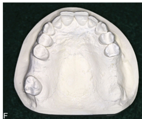
Fonte: CARR, Alan B. McCracken prótese parcial removível . Rio de Janeiro: Grupo GEN, 2017.

Um paciente do sexo masculino, 54 anos de idade, procura atendimento odontológico com a intenção de colocar uma prótese no arco superior. No exame clínico, o cirurgião-dentista verifica a ausência de alguns dentes conforme imagem ao lado.