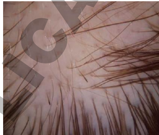
Internet: Atlas de dermatologia : da semiologia ao diagnóstico / editores Luna Azulay- Abulafia ... [et al.]. - 3. ed. - Rio de Janeiro : GEN | Grupo Editorial Nacional S.A. Publicado pelo selo Editora Guanabara Koogan Ltda., 2020.

Um homem, 40 anos de idade, apresenta perda de cabelo não cicatricial em áreas arredondadas no couro cabeludo, sem outros sintomas sistêmicos. Considerando o caso clínico e a imagem, no que diz respeito ao diagnóstico, assinale a alternativa correta.