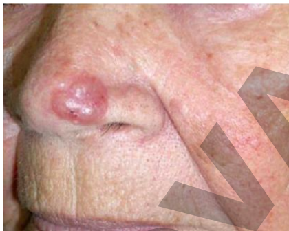
Internet: Atlas de dermatologia : da semiologia ao diagnóstico / editores Luna Azulay- Abulafia ... [et al.]. - 3. ed. - Rio de Janeiro : GEN | Grupo Editorial Nacional S.A. Publicado pelo selo Editora Guanabara Koogan Ltda., 2020.

Um paciente apresenta uma mancha avermelhada na ponta do nariz há 8 meses, que inicialmente era pequena e elevada, mas cresceu formando uma placa eritematosa lisa e infiltrada, sem prurido ou dor. Ele nega trauma local ou exposição solar recente. A lesão não respondeu a tratamentos tópicos com corticoides e pomadas antibióticas.