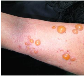
Internet: Atlas de dermatologia : da semiologia ao diagnóstico / editores Luna Azulay- Abulafia ... [et al.]. - 3. ed. - Rio de Janeiro : GEN | Grupo Editorial Nacional S.A. Publicado pelo selo Editora Guanabara Koogan Ltda., 2020.

Uma mulher, 35 anos de idade, apresenta lesões bolhosas precedidas por prurido (conforme imagem) há 2 semanas, iniciando com áreas avermelhadas que evoluíram para bolhas tensas, que se romperam, resultando em erosões dolorosas. Ela relata prurido, falta de apetite, febre, fraqueza e perda de peso no período, além de negar qualquer melhora com o uso de pomadas antialérgicas.