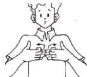
Felipe, Tanya A. Libras em Contexto

Em uma situação que determinada pessoa surda e muda estava solicitando orientação sobre a proximidade de um hospital, um pedestre, com conhecimentos de Libras, fez a seguinte representação: