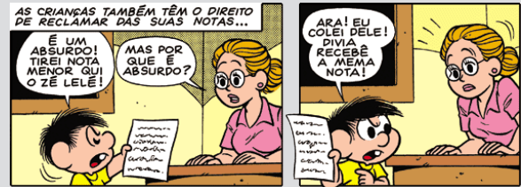
Turma da Mônica. Maurício de Souza