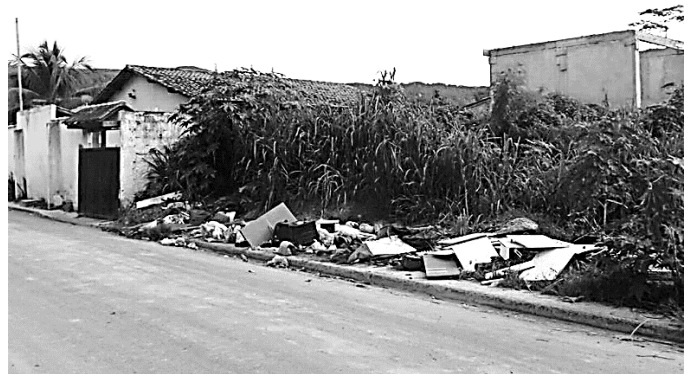
Disponível em: < https://oglobo.globo.com/eu-reporter/terreno-abandonado-acumula-lixo-no-engenho-do-mato-em-niteroi-19217730 >. Acesso em: out. 2024.

Considerando a Lei nº 950/2023 que institui o Código de Posturas do Município de Carmo do Rio Verde e dá outras providências, a imagem acima, que mostra um lote urbano desocupado sem estrutura de proteção vertical impedindo o acesso pela via pública e com presença de acúmulo de resíduos sólidos e densa vegetação, em termo de infração passível de multa, apresenta qual situação?