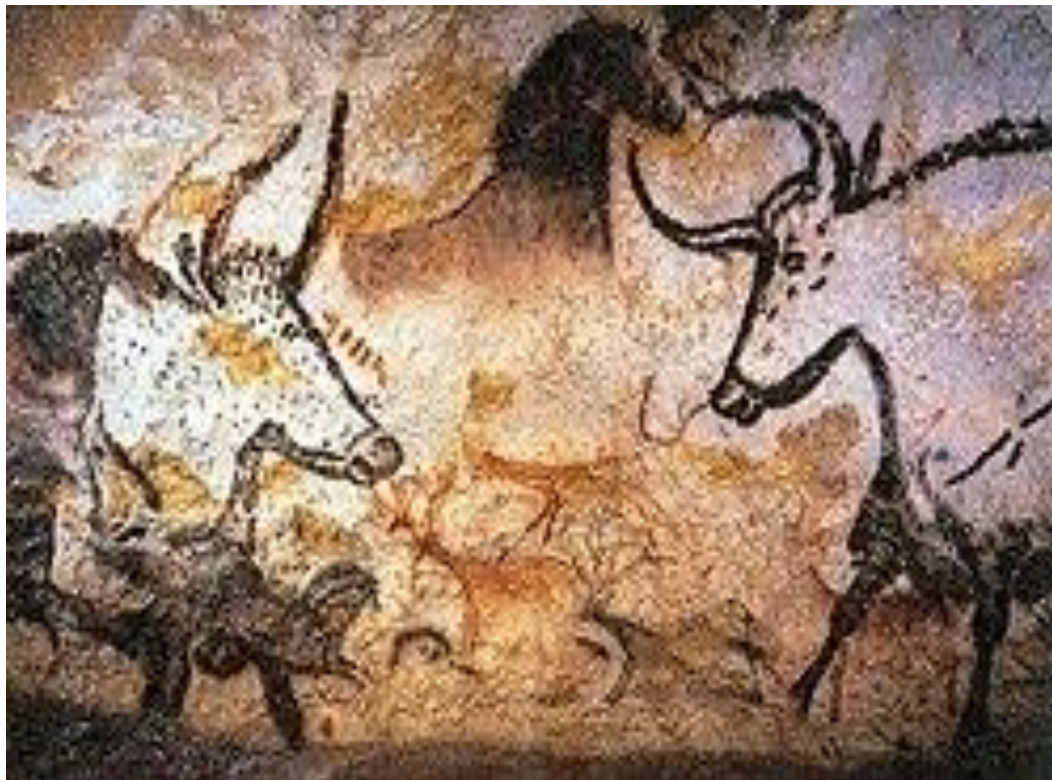
Pintura Rupestre encontrada no Sítio Arqueológico de Lascaux, na França.

As representações artísticas pré-históricas realizadas em paredes, tetos e outras superfícies de cavernas e abrigos rochosos são denominadas Arte Rupestre. Esta, por sua vez, divide-se entre a pintura rupestre (composições realizadas com pigmentos) e a gravura rupestre (imagens gravadas em incisões na própria rocha.)