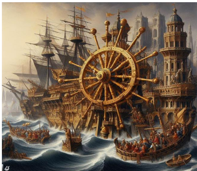
The main driving force of the great navigations in the 15th century - Generated with AI. 2023.

Tendo em vista as Grandes Navegações do século XV, qual o seu principal motor?