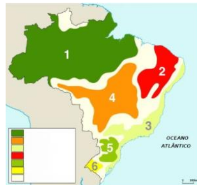
Figura 1: Domínios Morfoclimáticos do Brasil