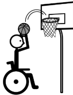
Figura 1 – Ferramenta de acessibilidade utilizada na CAA.