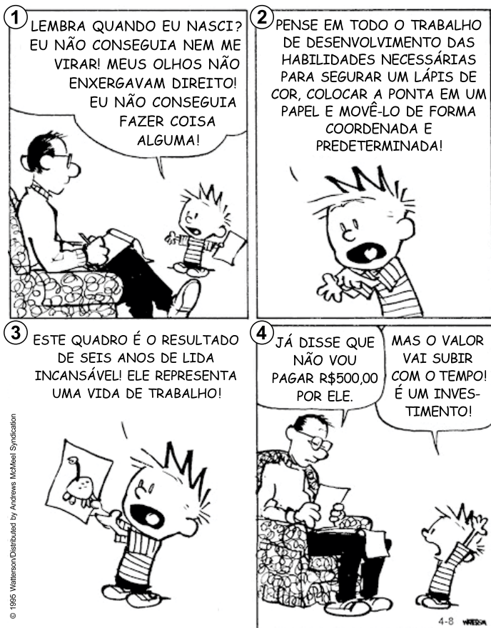
(Bill Waterson. O melhor de Calvin . www.estadao.com.br, 08.04.2025)

Leia a tira a seguir para responder às questões 01 a 03: