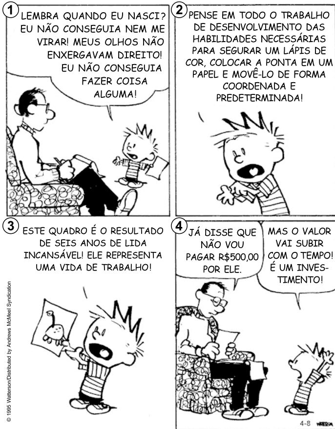
(Bill Waterson. O melhor de Calvin . www.estadao.com.br, 08.04.2025)

Leia a tira a seguir para responder às questões 01 a 03: