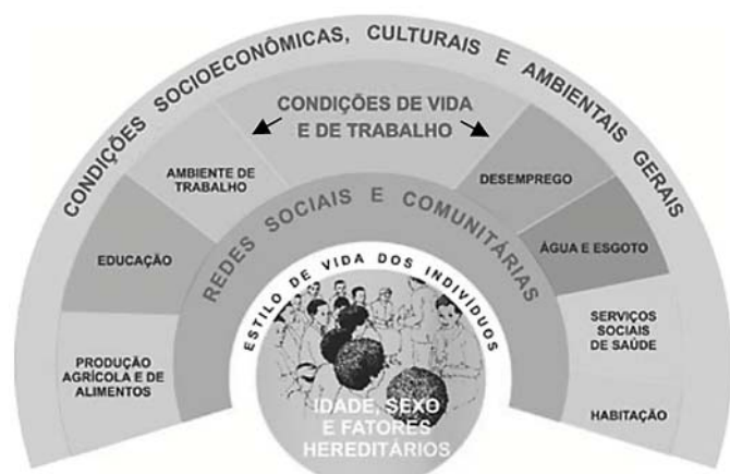
Figura 1 – Determinantes sociais: modelo de Dahlgren e Whitehead

BUSS, P.M.; PELLEGRINI FILHO, A. A saúde e seus determinantes sociais. PHYSIS: Rev. Saúde Coletiva , Rio de Janeiro, v. 17, n.1, 2007.