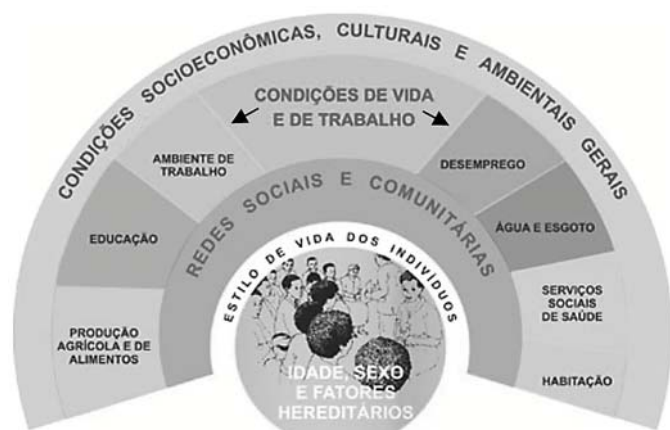
Figura 1 – Determinantes sociais: modelo de Dahlgren e Whitehead BUSS, P.M.; PELLEGRINI FILHO, A. A saúde e seus determinantes sociais. PHYSIS: Rev. Saúde Coletiva , Rio de Janeiro, v. 17, n.1, 2007.

O modelo de Dahlgren e Whitehead inclui os Determinantes Sociais da Saúde (DSS), dispostos em diferentes camadas, desde uma camada mais próxima dos determinantes individuais até uma camada distal, em que se situam os macrodeterminantes. Como se observa na figura apresentada,