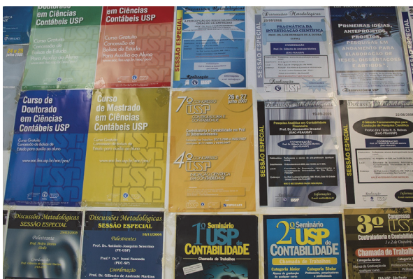
Observatório USP de Educação e Pesquisa Contábil.

A vida no ambiente acadêmico é repleta de cartazes utilizados para promover atividades, eventos, opiniões políticas e produtos dentro dos campi . Estas peças visuais estão presentes na maior parte das unidades, restaurantes universitários, pontos de ônibus dentro dos campi , entre outros locais. Alguns exemplos encontram-se a seguir: