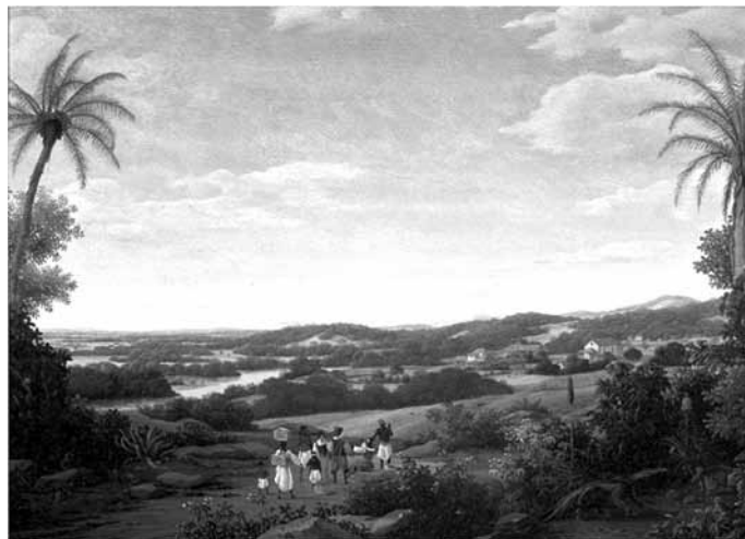
(Paisagem com Tamanduá, 1660-80. Óleo sobre tela. Coleção MASP. https://masp.org.br/acervo/obra/paisagem-com-tamandua )

A obra Paisagem com Tamanduá foi produzida no contexto da ocupação holandesa no Brasil. Seu autor é