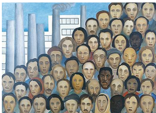
Operários, 1933, Tarsila do Amaral, óleo sobre tela, c.l.d. 150,00 cm x 230,00 cm Acervo Artístico-Cultural dos Palácios do Governo do Estado de São Paulo. Palácio Boa Vista (Campos do Jordão, SP)

Em relação à pintura "Operários", de Tarsila do Amaral, no contexto do modernismo brasileiro, assinale: