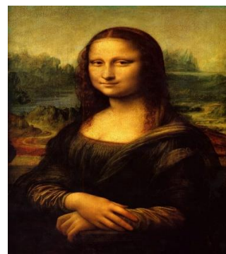
Autor: Leonardo da Vinci. Pintura a óleo sobre madeira de álamo. Dimensões: 77 cm x 53 cm. Museu do Louvre