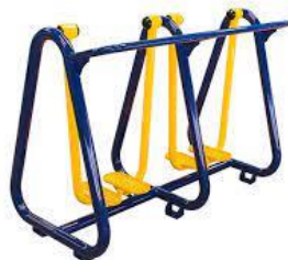
3 - Simulador de Caminhada