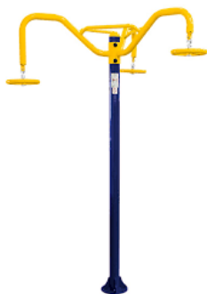
1 - Alongador de três alturas

26. Sobre os equipamentos da Academia da Terceira Idade (ATI), associe o nome/figura a sua finalidade: