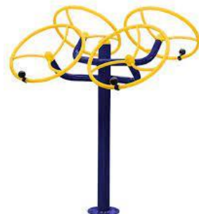
4 - Rotação Diagonal Duplo

( ) Fortalece a Musculatura Lateral do Abdômen.