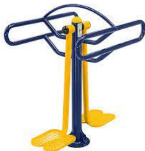
2 - Surf Duplo