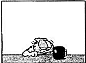
GARFIELD - Jim Davis