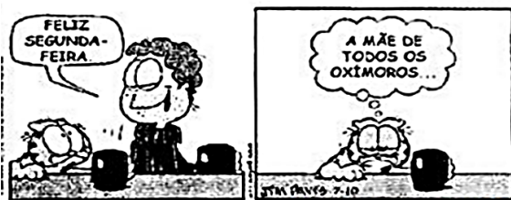
Folha de S. Paulo. 31 de julho de 2000.