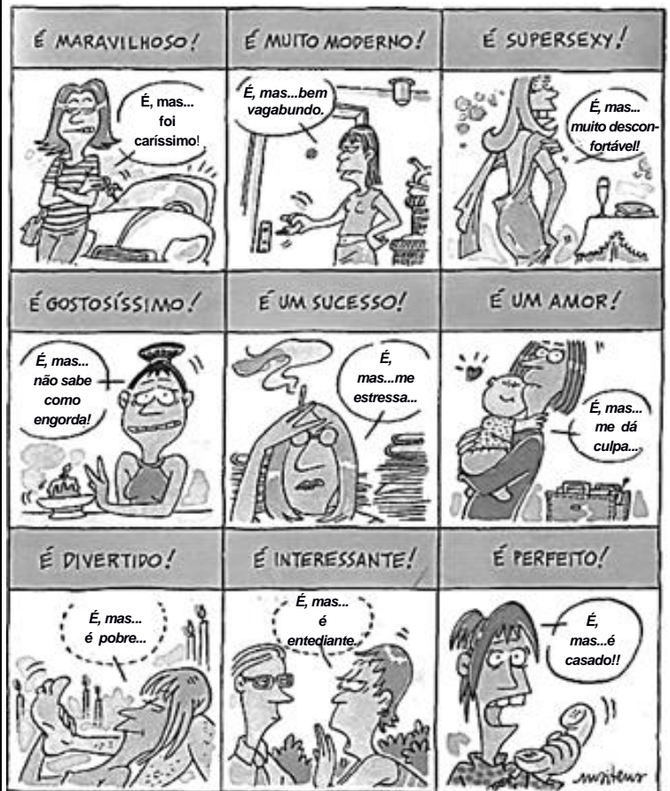
MAITENA. Mulheres Alteradas . Rio de Janeiro: Rocco, 2003. p. 36

10 O título da tirinha “As mulheres e o eterno mas...” sugere uma crítica