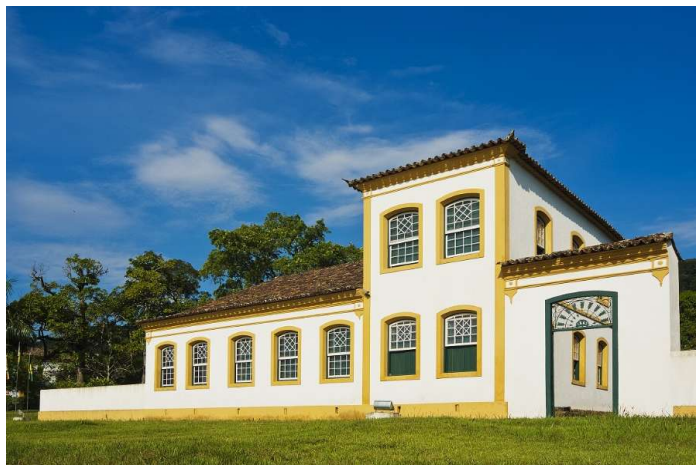
Imagem 1: Casa dos Açores - Museu Etnográfico.

A Casa dos Açores – Museu Etnográfico (Imagem 1) está abrigada em prédio construído no século XIX, no município de Biguaçu (SC). O museu forma, junto com a Igreja de São Miguel Arcanjo e os arcos do antigo aqueduto, um importante atrativo turístico para o município e o estado. Além de contar com um acervo de móveis, roupas e outras peças que visam à preservação e ao estudo da cultura açoriana no país, o espaço serve também para exposições e a comercialização de artesanato local (Fundação Catarinense de Cultura - FCC).