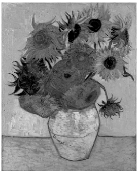
Imagem: Vincent Van Gogh - Vaso com 12 girassóis (1888).

Em uma turma com crianças de 5 anos, na escola de Educação Infantil, uma delas compartilhou na roda de conversa que era primavera e encontrou muitas flores no jardim da entrada. Foi um alvoroço agradável, pois cada criança queria falar sobre o tema. Percebendo o interesse coletivo e o contexto primaveril tão pertinente, a professora levou a turma para observar, desenhar, cantar músicas que conheciam sobre o tema e também pintarem da forma como desejassem o que sentiam, percebiam e viam. Então, depois de exporem suas obras no varal da sala, que foi muito além de flores, a professora em outro dia apresentou à turma uma das séries de sete obras na qual Van Gogh retratava diferentes girassóis (em cor, quantidade e forma), como na imagem da questão. Sobre essa sequência pedagógica, relacionada ao trabalho com artes na Educação Infantil, analise as assertivas a seguir.