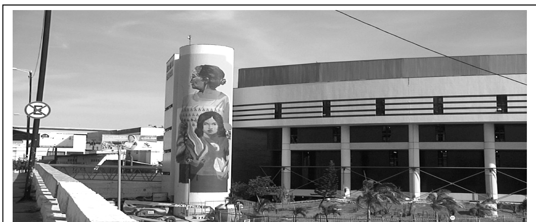
Figura 3.

A figura 3 mostra uma parede na fachada do Mercado Central de Fortaleza com uma imensa intervenção, uma pintura de 30 metros. Uma composição realizada pelos artistas Tereza Dequinta e Robézio Marqs, do Acidum Project, foi inspirada nas mulheres de Fortaleza. O painel intitula-se, "Iracemas". Como se chama esta manifestação artística urbana?