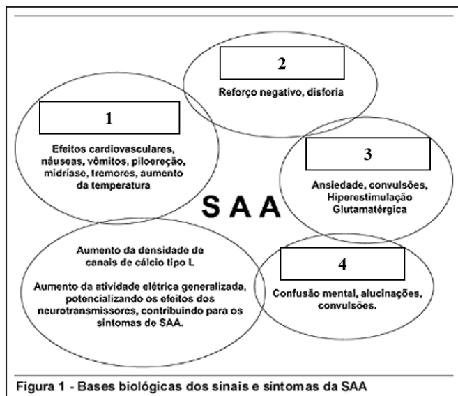
Figura 1 - Bases biológicas dos sinais e sintomas da SAA