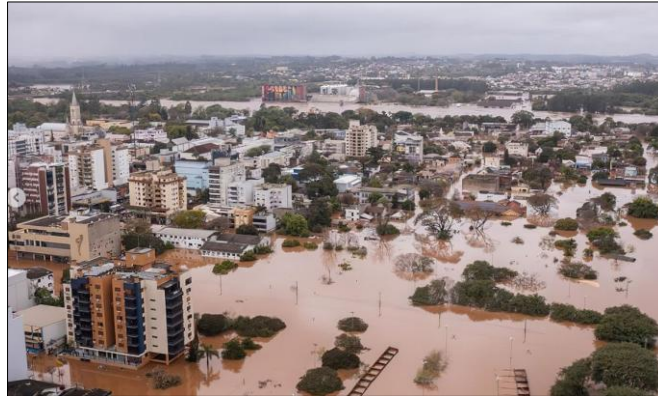
(Marcelo Caumors. Enchentes no Rio Grande do Sul, 2023.)