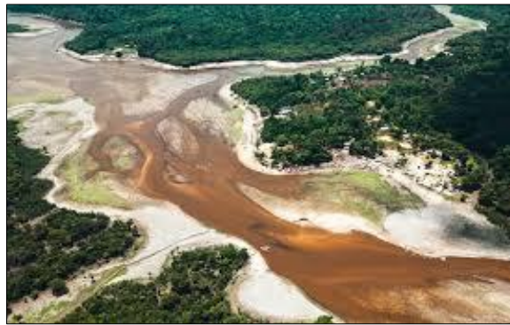
(Ademar Cruz. Seca na Amazônia. Fundação Amazônia Sustentável, 2023.)

Recentemente, o Brasil vivenciou uma série de eventos extremos, como enchentes no Sul e secas severas na Amazônia. Esses fenômenos têm relação direta com: