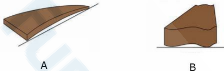
Figura 1 Sem escala

QUESTÃO 35 – A figura 1 a seguir apresenta diferentes defeitos observados em peças de madeira segundo a NBR 15798:2010: