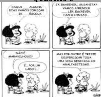
(10 anos de Mafalda, Adaptado)

As lacunas da tirinha devem ser preenchidas, correta e respectivamente, com: