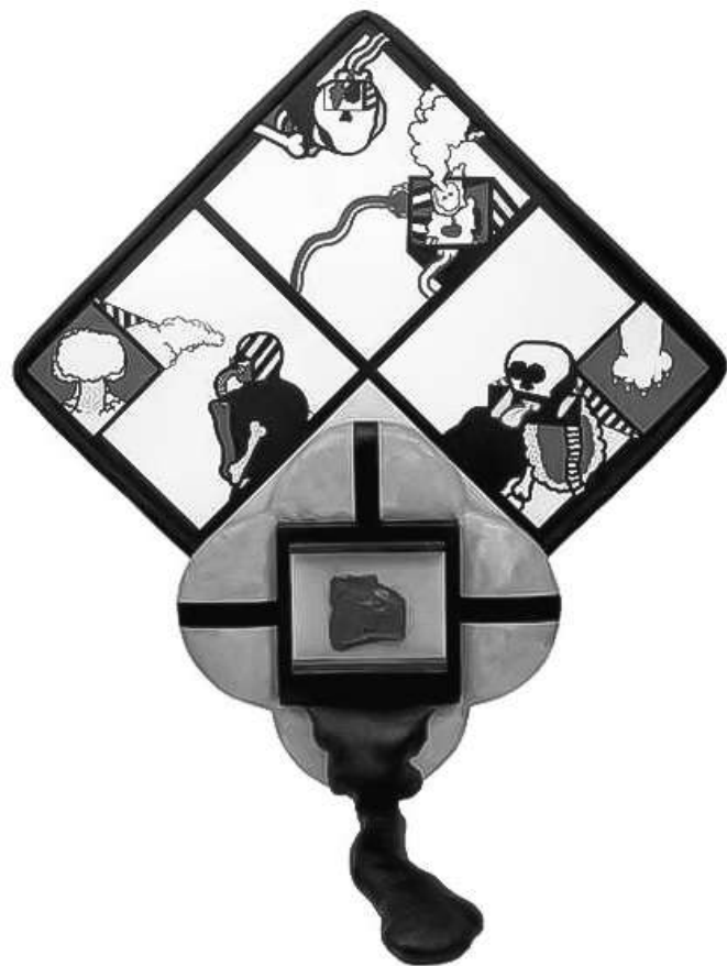
Notas sobre a morte imprevista (1965) - Antônio Dias