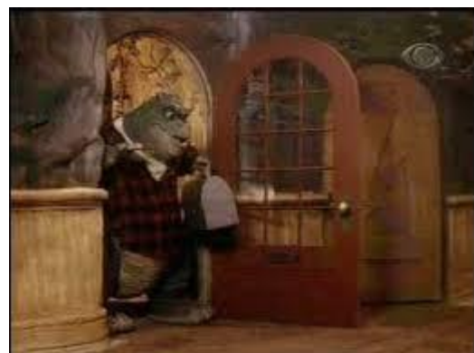
54 - Figura 01