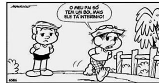
SOUSA, Maurício de. Chico Bento . Disponível em < https://www.todamateria.com.br/figuras-de-linguagem/ >.

A expressão “cabeças de gado”, empregada no quadrinho acima, apresenta a figura de linguagem conhecida por: