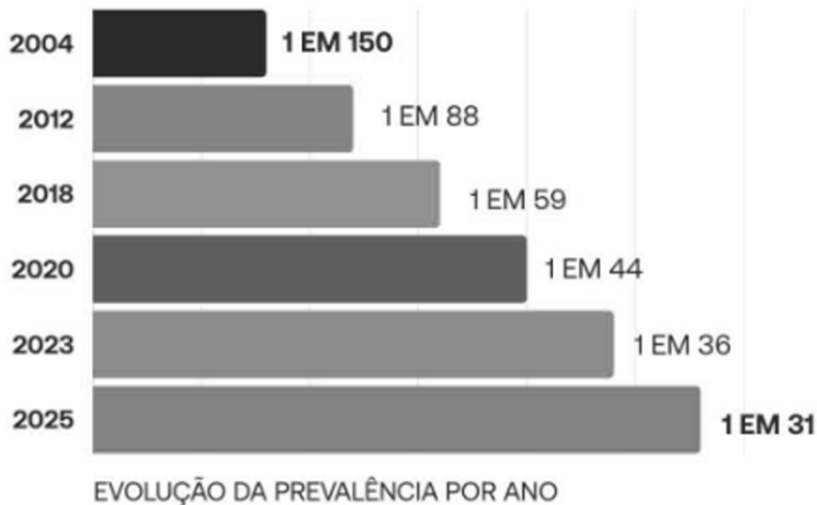
Figura: Prevalência do Autismo (2004-2025) nos Estados Unidos.

Analise a figura, avaliando as asserções a seguir e a relação proposta entre elas.