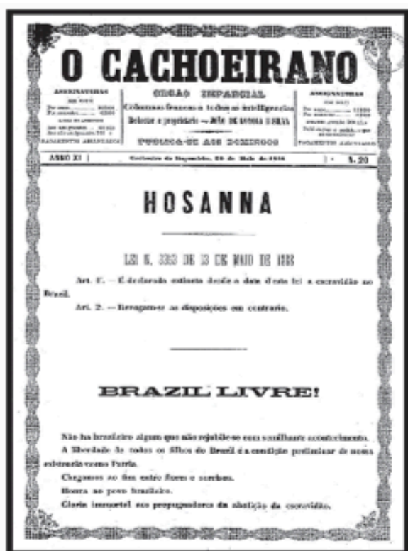
Edição comemorativa da Lei de Abolição da Escravidão, maio de 1888

À direita, cartaz de 1988, em cores, divulgado pelo Movimento Negro do Rio de Janeiro. O cartaz traz os dizeres: “1888 Lei Áurea – 1988 Nada Mudou – Vamos Mudar”, com a chamada para a Marcha contra a Farsa da Abolição.