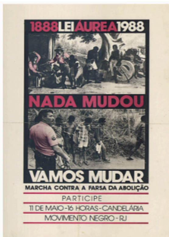
Cartaz de divulgação da Marcha contra a farsa da abolição, maio de 1988

Disponível em: https://hemeroteca-pdf.bn.gov.br/217719/per217719_1888_00020.pdf / Acesso em: 22/09/2023