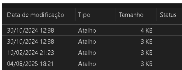
Figura 2: Zoom das informações.