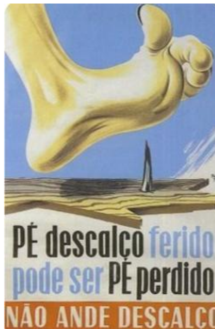
CARTAZES PUBLICITÁRIOS. Disponível em < https://pt.pinterest.com/engiverca/cartazes-publicitarios/ >.

No cartaz publicitário acima, é correto afirmar que: