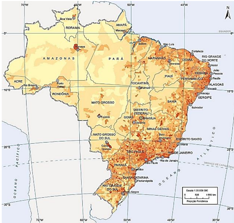
Atlas Geográfico Escolar Fonte: Censo Demográfico (IBGE, 2022).

Considerando os dados demográficos do Brasil divulgados no Censo de 2022, assinale a alternativa correta.