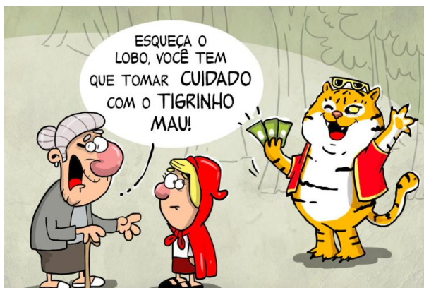
CAZO, Luiz Fernando. Enquanto isso no país das bets... Disponível em < https://blogdoaftm.com.br/charge-enquanto-isso-no-pais-das-bets/ >.

Para uma adequada interpretação da charge acima, é necessário ter conhecimento de mundo a respeito: