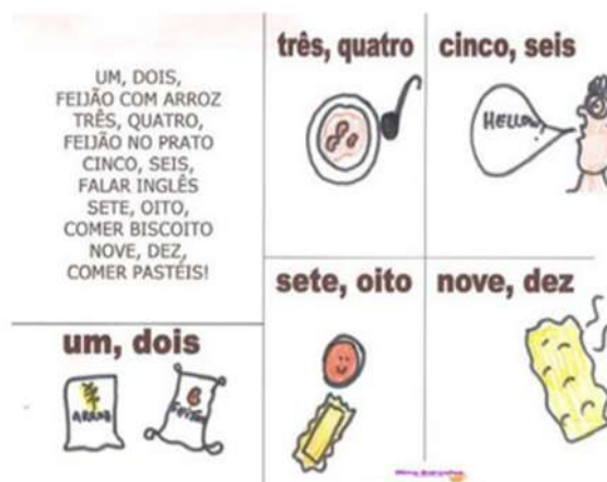
Figura 11-1: Música: Um, Dois, Feijão com Arroz

Fonte: Criciúma (SC). Prefeitura Municipal. Secretaria Municipal de Educação. Diretrizes Curriculares da Educação Infantil do Município de Criciúma [recurso eletrônico]: A criança como protagonista da aprendizagem. 2. ed. Criciúma, SC: Secretaria Municipal de Educação, 2020.