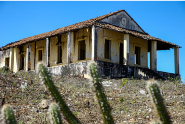
Figura 3. Campo de concentração tombado patrimônio histórico-cultural em Senador Pompeu.

Em 2019, as ruínas desses campos foram tombadas como patrimônio histórico-cultural municipal, o que motivou discussões sobre apagamento de memórias, construção identitária e o papel da escola no reconhecimento dessas práticas autoritárias. As condições nos campos eram precárias, marcadas por escassez alimentar, falta de infraestrutura e alta incidência de doenças.