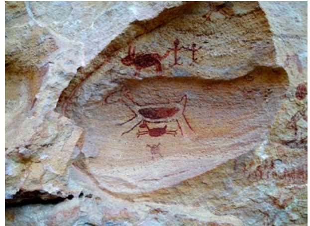
Figura 1. Pintura rupestre na Serra da Capivara. Registro da presença pré-histórica no Brasil.

marítimas, e novas descobertas arqueológicas têm repositado cronologias consideradas consolidadas no século XX.