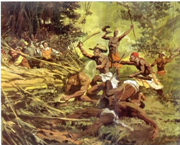
Figura 2. A Guerra dos Palmares. Manoel Vitor. óleo sobre tela. (1955)

50. (PMM/URCA 2025) A pintura A Guerra dos Palmares (1955), do artista plástico, desenhista, ilustrador e cartunista paulistano Manoel Victor de Azevedo Filho (1927-1995), representa uma cena idealizada de resistência do Quilombo dos Palmares contra forças coloniais portuguesas. Em anos recentes, imagens semelhantes vêm sendo manipuladas digitalmente mediante o uso da Inteligência Artificial e rerepresentadas em redes sociais como se retratassem conflitos contemporâneos em favelas brasileiras. Segundo reportagem da BBC (2024), deepfakes e reconstruções visuais adulteradas passaram a alimentar desinformação histórica, reforçando narrativas racistas, violentas ou anacrônicas sobre grupos sociais negros, indígenas e periféricos. Em uma sala de aula do ensino fundamental, uma versão dessa pintura circula entre estudantes, agora editada digitalmente para representar guerrilheiros de Palmares enfrentando policiais armados no Complexo do Alemão, em um suposto evento datado de 2025.