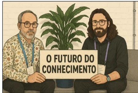
Fundador da enciclopédia critica respostas automáticas e alerta para impacto da IA na qualidade do conhecimento livre.

Wales foi categórico ao dizer que não quer IA generativa escrevendo ou editando a Wikipédia. A força da Wikipédia está na profundidade e no detalhe que emergem do processo colaborativo humano, algo difícil de replicar por uma máquina sem incorrer em erros e generalizações. “O mundo depende da Wikipédia e os modelos de IA dependem da Wikipédia”, disse Wales enfaticamente.