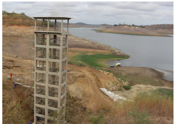
Torre construída para calcular volume já está totalmente descoberta pela água do açude de Boqueirão, na Paraíba (18/04/2017)

No ano de 2016, num período de grande estiagem, mais precisamente em março, o açude Epitácio Pessoa chegou ao seu menor nível de volume de água acumulado: 2,9%. O açude esteve à beira de um colapso e o cenário pedia uma rápida conclusão